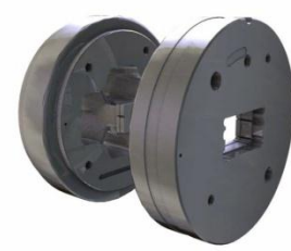
Werkzeug für Hohlprofile